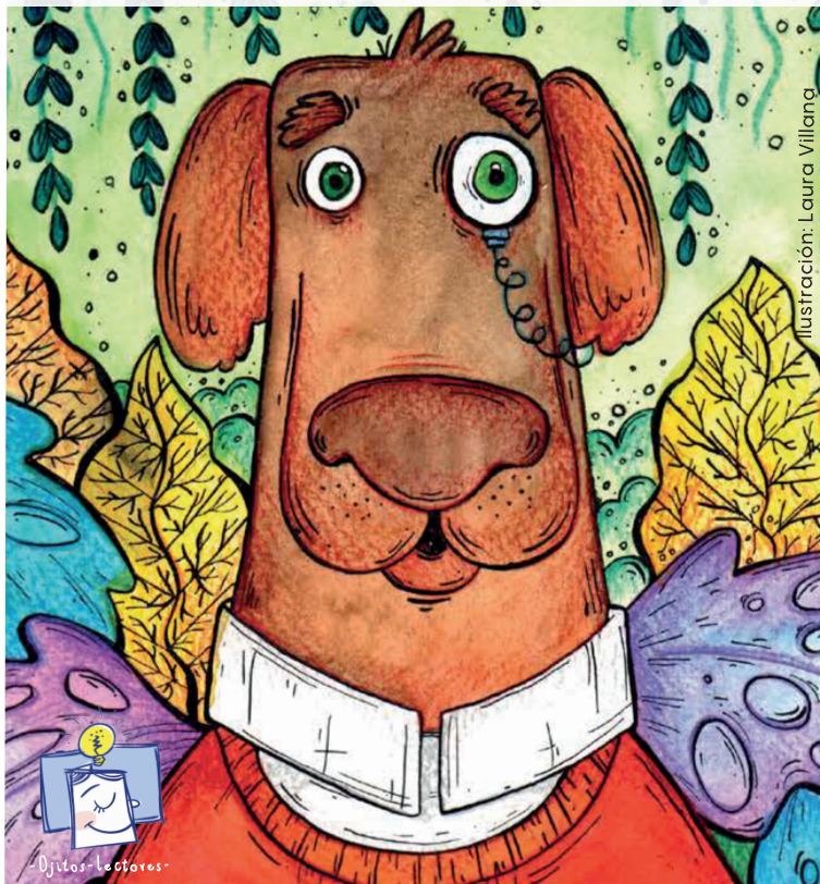
Ilustración: Laura Villana