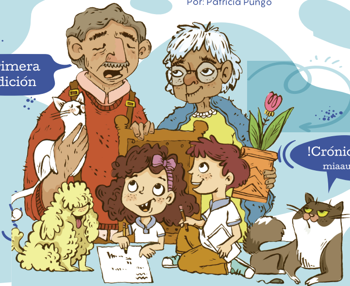
Ilustración: Laura Villana