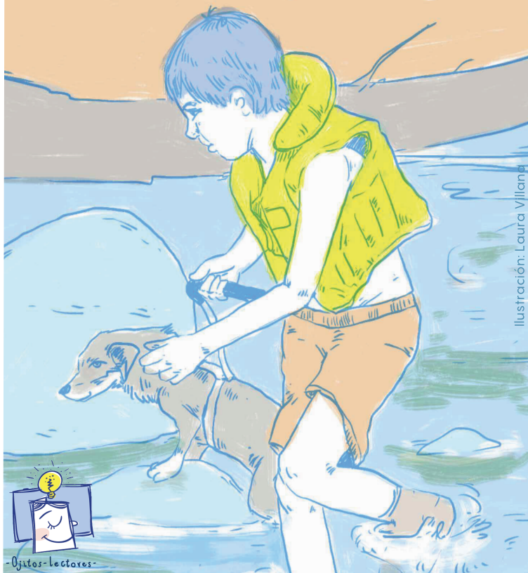
Ilustración: Laura Villana