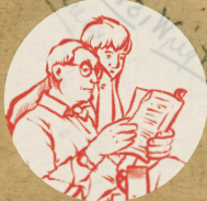
Ilustración: Laura Villana